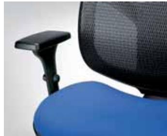
Sitz gepolstert, Rücken in Netzversion seat upholstered, backrest in mesh