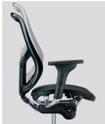
Rückenlehnenhöhenverstellung backrest height adjustment