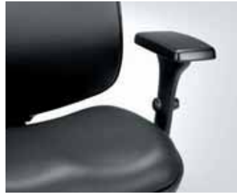
Sitz und Rücken gepolstert upholstered seat and backrest

Die Technik mit dem Wohlgefühl-Gen. Technology with the feelgood factor.