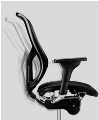
Synchronmechanik synchron mechanism