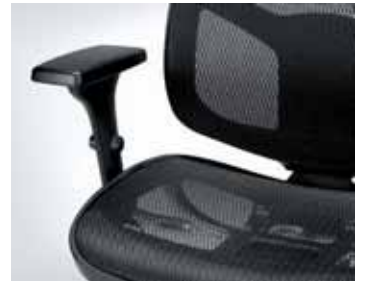
Sitz und Rücken in Netzversion seat and backrest in mesh