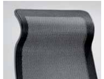
Integrierte Nackenstütze integrated neck support

Manche Dinge faszinieren durch ihre Optik, andere durch ihre Funktion. Und einige wenige vereinen diese beiden Eigenschaften. Airspace zum Beispiel. Er kombiniert modernes Design mit Hightech. Das Ergebnis ist ein Bürostuhl, der auf den ersten Blick überzeugt. Seine wertigen Materialien für Sitz und Rückenlehne bieten zum einen die Auswahl für jeden Geschmack. Zum anderen ein angenehmes Sitzgefühl – ganz nach Ihren individuellen Wünschen wählen Sie durchgängig Netzgewebe, Stoff oder Leder. Oder Sie kombinieren.