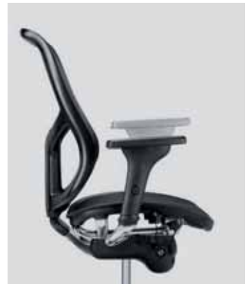
Multifunktionsarmlehne multifunction armrests