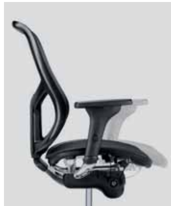
Sitztiefeverstellung seat depth adjustment